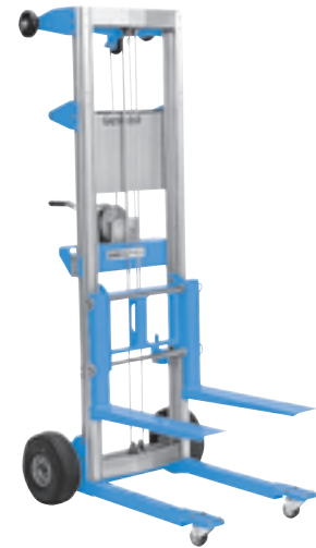
(1) Solo en recambios